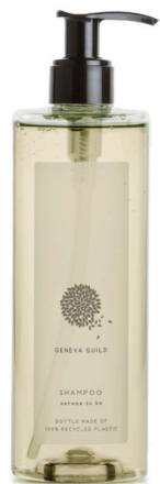
DISPENSER 11,39 €/litro