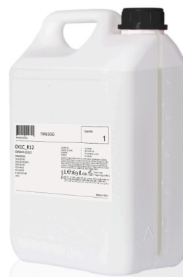
TANICA DI RICARICA 4,84 €/litro

Nell'esempio sopra riportato è stata analizzata la differenza di costo tra l'utilizzo di un flacone mono dose Geneva Guild, un Dispenser inviolabile e Dispenser ricaricabile.