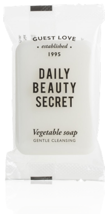
SAPONE VEGETALE 30 g e Net wt. 1.05 oz. B0830GL