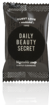
SAPONE VEGETALE 8 g e Net wt. 0.28 oz. B0808GL