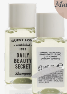
22 ml e 0.74 fl.oz.

DERMATOLOGICAMENTE TESTATO TESTATO PER IL NICKEL SENZA BHT SENZA PETROLATO