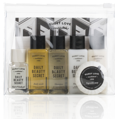
POCHETTE AMENITIES 15 x 12,5 x 4,5 cm K052GL

Questo sapone vegetale è ideale per l'igiene quotidiana. La sua azione delicata fa sì che possa essere utilizzato su tutto il corpo, lasciando la pelle rinfrescata e pulita.