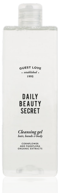
SAPONE LIQUIDO 480 ml e 16.23 fl. oz. FLR500MGL

Questo sapone liquido è arricchito con fiordaliso ed estratti organici di passiflora con proprietà rilassanti, donando un tocco delicato che lascia il capello rivitalizzato e vibrante.