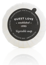
SAPONE VEGETALE 20 g e Net wt. 0.70 oz. B0220GL