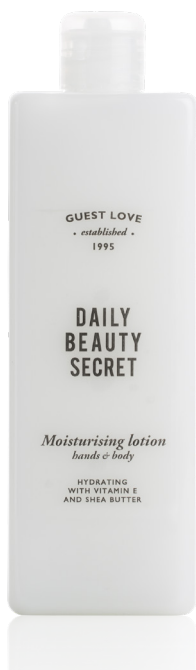
CREMA IDRATANTE 480 ml e 16.23 fl. oz. FLR500BLGL

DERMATOLOGICAMENTE TESTATO TESTATO PER IL NICKEL SENZA BHT