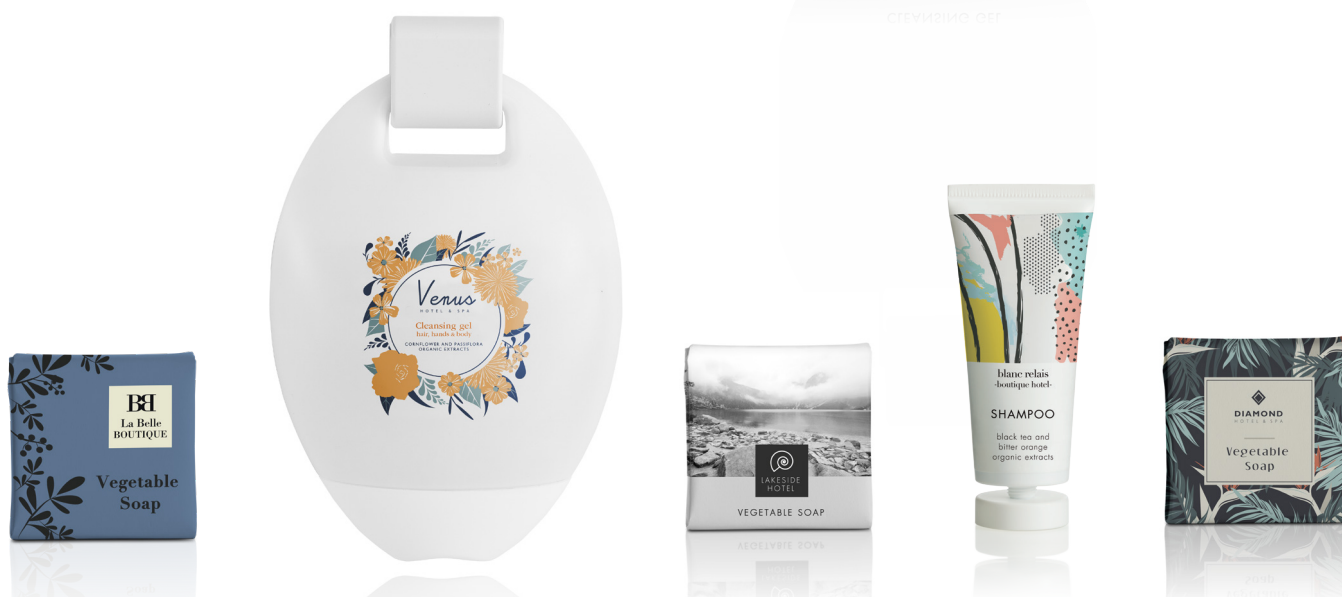
PERSONALIZZAZIONE CON COLORI A SCELTA