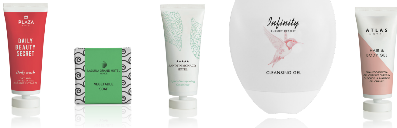
PERSONALIZZAZIONE CON GLI STESSI COLORI DELLA LINEA

* questa opzione è soggetta a un sovrapprezzo. Vedi il listino prezzi per i dettagli.